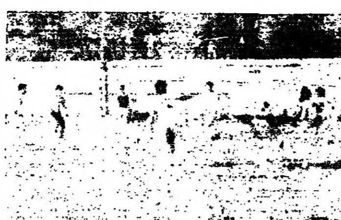
لجنة انشاء المباراة على ملعب جديدا